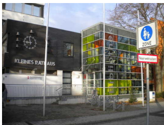
Tourist-Information Salzgitter - Nebenstelle in der Stadtbibliothek