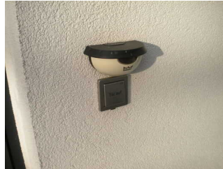
Mantelbogen visuell taktile Gestaltung