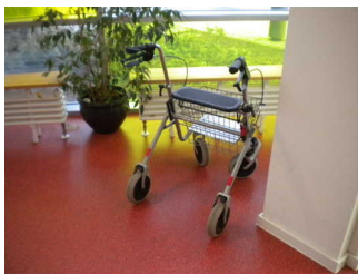
Alarm/Hilfsmittel - Erstgespräch