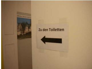
Mantelbogen visuell taktile Gestaltung