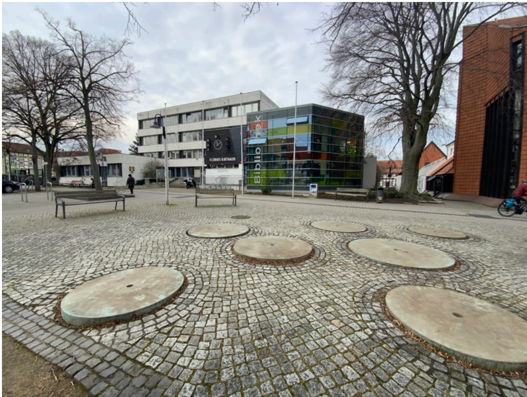
Tourist-Information Salzgitter – Nebenstelle in der Stadtbibliothek