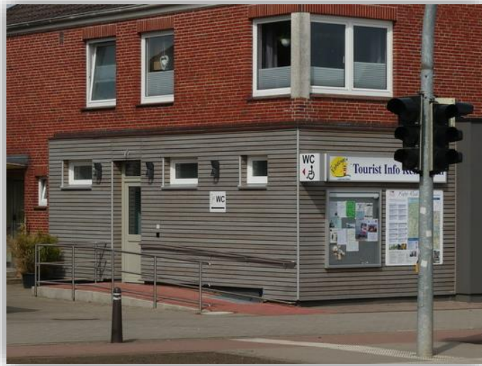
Tourist-Info Kehdingen Wischhafen