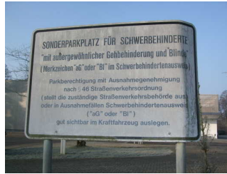
Schild an den Parkplätzen mit Hinweis für Schwerbehinderte