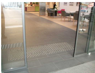
taktile Bodenbeläge vor jeder Tür im Kurhaus