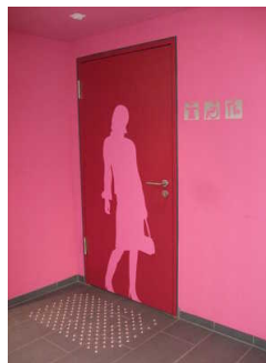
Öffentliches WC für Frauen