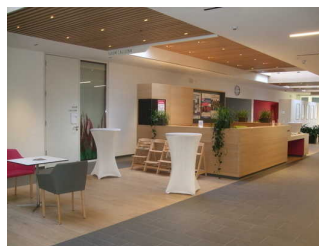
Counter/Kasse im Foyer

Das Kassendisplay/die Preisangabe an der Kasse ist gut erkennbar (z.B. groß oder schwenkbar).