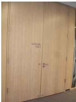
Tür zum Kursaal