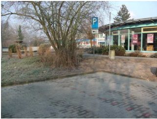
gekennzeichneter Parkplatz vor dem Kurhaus