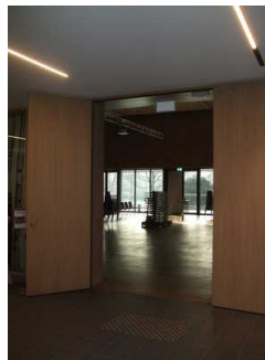
geöffnete zweiflügelige Tür zum Kursaal