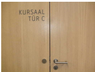
Beschilderung Kursaal tür