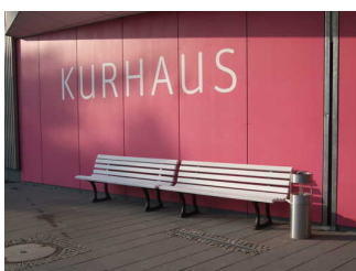
Kurhaus mit Tourist-Info Bad Bevensen