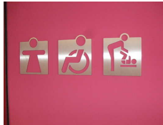
Beschilderung öffentliches WC