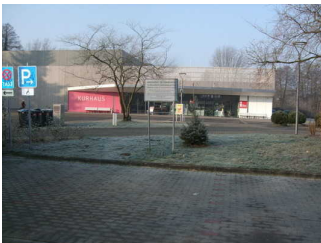
4 gekennzeichnete Parkplätze

Es ist ein allgemeiner Parkplatz vorhanden.