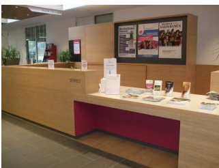
Counter/Kasse im Foyer