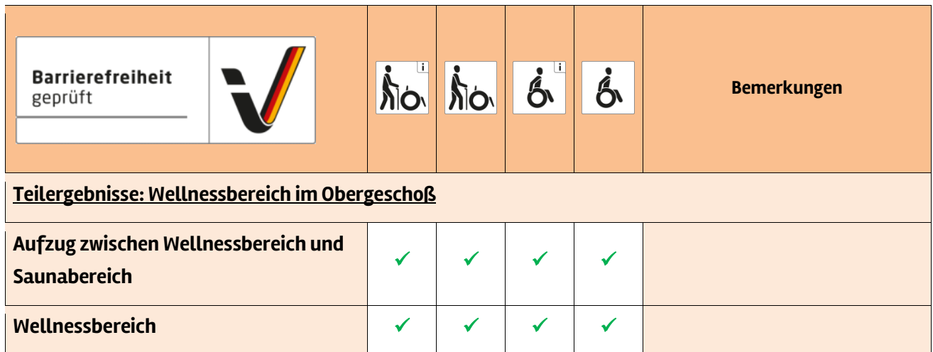
Tabelle 1: Überblick über das Prüfergebnis