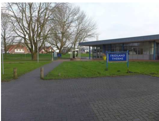
Weg vom Parkplatz bis zum Eingang