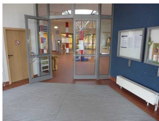
Eingangsbereich der Friesland Therme