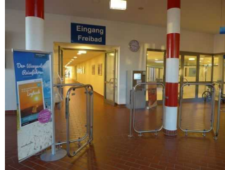
Durchgang für Menschen mit Behinderungen zum Umkleidebereich