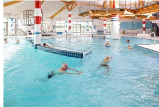
Hallenbadbereich Friesland Therme