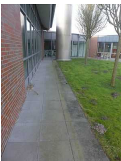
Weg vom Hallenbad in den Freibadbereich