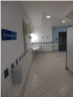
Weg zu den Umkleidekabinen für Menschen mit Behinderungen