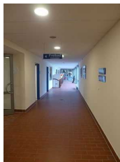
Flur zum Freibadbereich der Friesland Therme