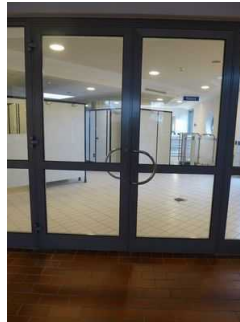
Tür zum Gang zu den Umkleidekabinen