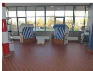
Sitzgelegenheit im Foyer neben der Kasse