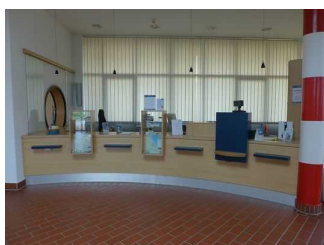
Kasse / Infotresen in der Friesland Therme Horumersiel