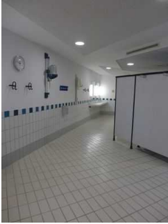
Gang zu den Umkleidekabinen