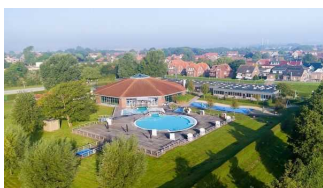
Luftaufnahme der Friesland Therme

Angebotsbeschreibung des Anbieters: Die Friesland-Therme in Horumersiel befindet sich im Wangerland an der Nordsee am UNESCO Weltnaturerbe Wattenmeer und ist mit einer Fläche von zirka 3.250 Quadratmetern, verteilt auf ihre Innen- und Außenerlebnisbecken, ein Highlight für jeden Liebhaber von Freizeit- und Erlebnisbädern.