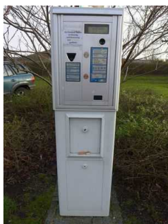
Parkautomat an der Friesland Therme