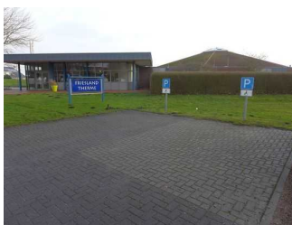
Parkplätze vor der Friesland Therme

Es ist ein allgemeiner Parkplatz vorhanden.