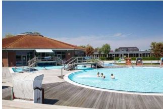
Freibadbereich Friesland Therme