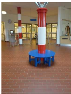
Sitzgelegenheiten im Foyer gegenüber der Kasse

Der Schalter/Tresen/die Kasse ist von der Eingangstür aus direkt sichtbar.