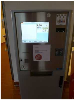
Nachzahlautomat im Kassenbereich der Friesland Therme

Die Menüführung der wesentlichen Funktionen erfolgt durch Sprachausgabe oder bildhaft.