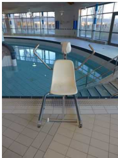
Beckenlift am Hauptschwimmbecken