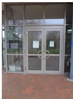
1. Eingangstür zur Friesland Therme

Name und Logo des Betriebes/der Einrichtung sind von außen klar erkennbar.