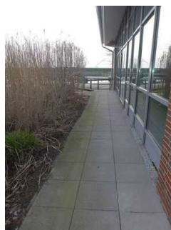
Weg zum Hauptschwimmbecken im Freibadbereich