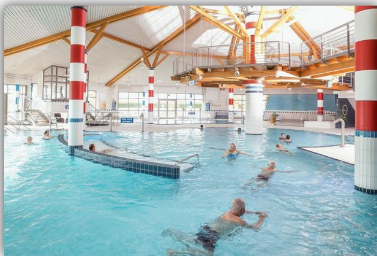
Friesland Therme Horumersiel