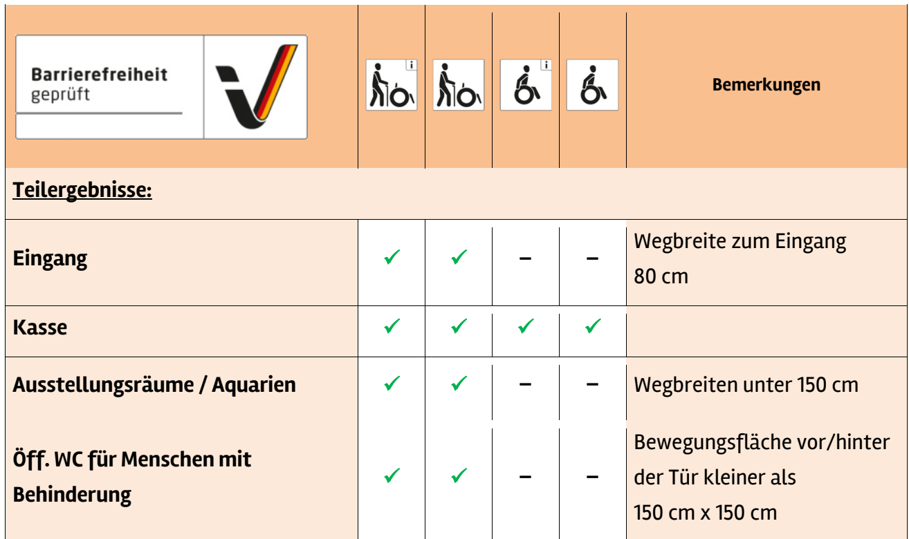
Tabelle 1: Überblick über das Prüfergebnis