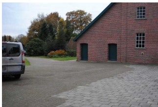
Parken auf dem Hof

Es ist ein allgemeiner Parkplatz vorhanden.