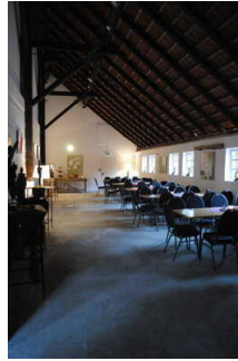
Café und Veranstaltungsraum

Es gibt Tische mit heller und blendfreier Beleuchtung.