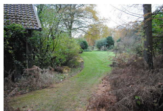
Weg im Garten