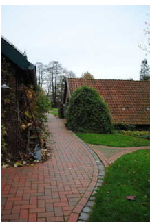
Weg im Garten