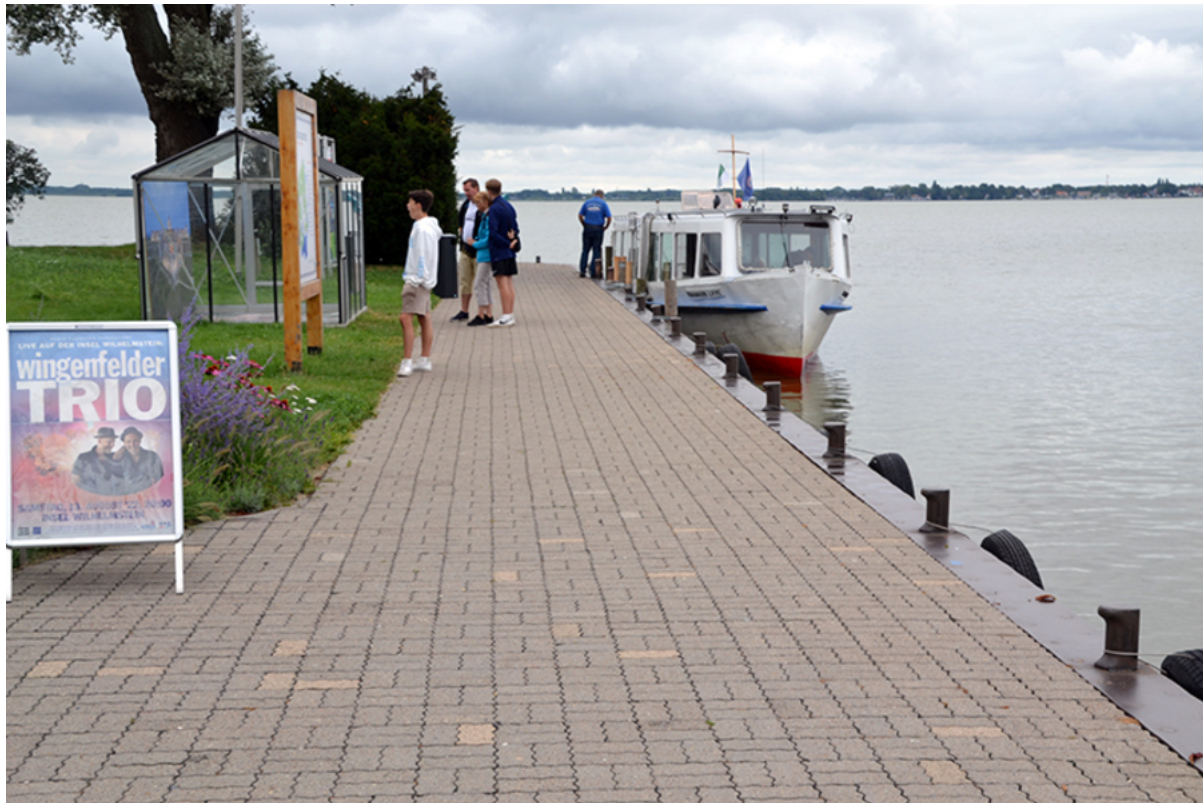
Anlegestelle Wilhelmstein