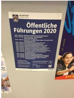
Technische Hilfsmittel in der Touristinfo im Bürgerbüro