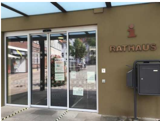
Eingang Rathaus (Holzberg)