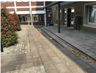
Treppe vor dem Eingang zum Rathaus (am Holzberg)