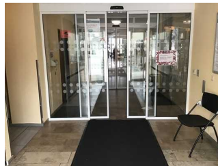
Eingang Rathaus (Holzberg)