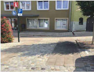
Weg vom Parkplatz zum Eingang (Holzberg)