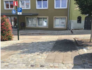
Weg vom Parkplatz zum Eingang (Holzberg)