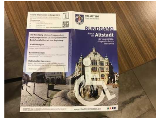
Technische Hilfsmittel in der Touristinfo im Bürgerbüro