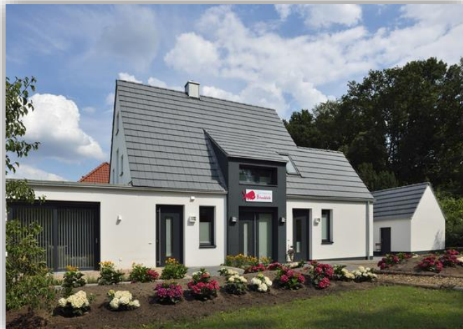
Außenansicht Ferienhaus Bisonblick