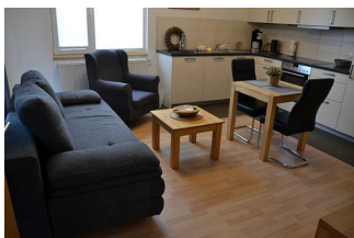
Wohnraum mit Küchenzeile