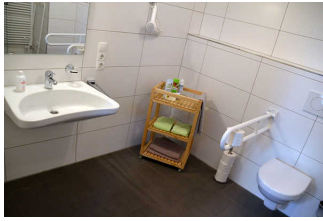
WC, Dusche, Waschraum