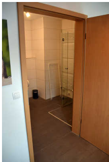
Sanitärraum mit Dusche und WC