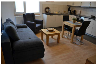
Wohnraum mit Küchenzeile