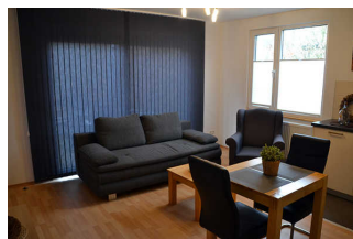
Wohnraum mit Küchenzeile