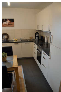
Küchenzeile in Wohnraum