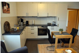
Küchenzeile in Wohnraum