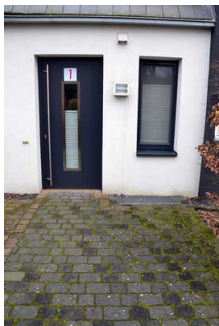
Eingangsbereich Ferienwohnung 1