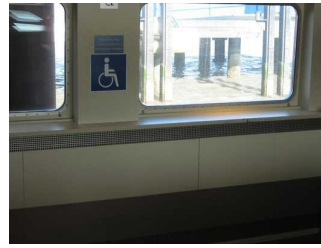
Vorgesehener Rollstuhlstellplatz auf dem Hauptdeck