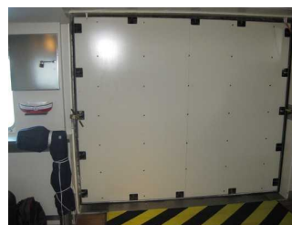
geschlossener Zugang zum Schiff

Name und Logo des Betriebes/der Einrichtung sind von außen klar erkennbar.