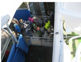
Fahrgastbrücke Zugang zum Schiff