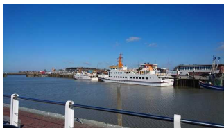
Schiff "Langeoog III"