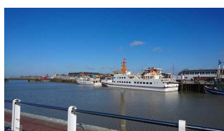
Schiff "Langeoog III"

Zugehörige Modulbögen: Eingang Schiff MS Langenoog III , Allgemeine Beschilderung