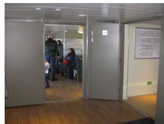
"Eingangsbereich" auf dem Schiff