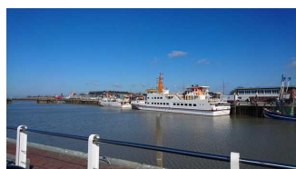
Schiff Langeoog III