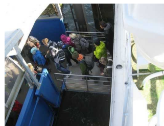
Zugang zum Schiff (Hauptdeck)