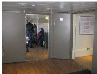
"Eingangsbereich" auf dem Schiff