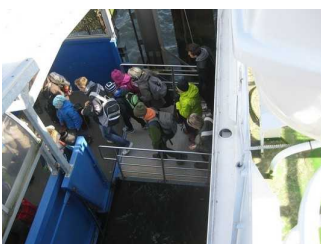
Fahrgastbrücke Zugang zum Schiff