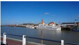
Schiff "Langeoog III"