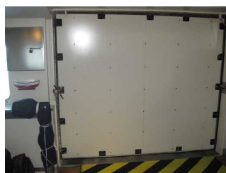
geschlossener Zugang zum Schiff

Der Eingangsbereich ist visuell kontrastreich zur Umgebung abgesetzt.