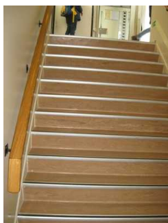
Treppe von Hauptdeck zum Panoramadeck