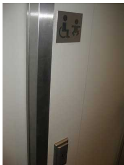
Tür zum Beh.-WC