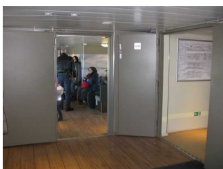
Durchgangstür auf dem Hauptdeck