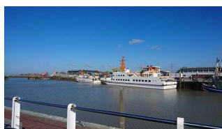
Schiff "Langeoog III"

Zugehörige Modulbögen: Eingang Schiff MS Langenoog III , Allgemeine Beschilderung