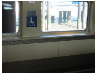
Vorgesehener Rollstuhlstellplatz auf dem Hauptdeck