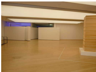
Ausstellungsraum 2.OG / 6. Ebene Horst-Janssen- Museum

Informationen zu den Exponaten werden schriftlich vermittelt. Es gibt akustische Informationen zu den Exponaten.