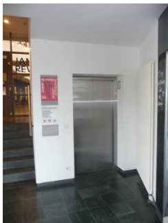
Aufzug Horst-Janssen-Museum / Stadtmuseum von Garderobe bis Ebene 8 mit Übergangsmöglichkeit ins Stadtmuseum