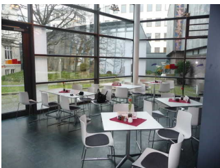
Café Farbwechsel im Horst-Janssen- Museum / Stadtmuseum