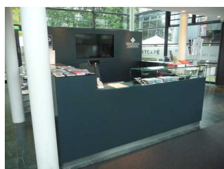
Eingangsbereich / Shop Horst- Janssen-Museum / Stadtmuseum