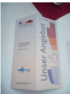
Speisekarte im Café Farbwechsel

Es gibt Tische mit heller und blendfreier Beleuchtung.