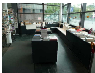
Eingangsbereich / Shop Horst- Janssen-Museum / Stadtmuseum