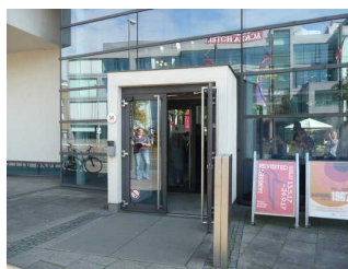
Eingangsbereich / Shop Horst- Janssen-Museum / Stadtmuseum