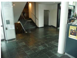
Aufzug Horst-Janssen-Museum / Stadtmuseum von Garderobe bis Ebene 8 mit Übergangsmöglichkeit ins Stadtmuseum

Ein abgehender Notruf im Aufzug wird akustisch bestätigt.