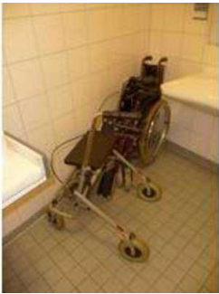
Hilfsmittel im Horst-Janssen-Museum/ Stadtmuseum