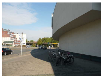
Horst-Janssen- Museum / Stadtmuseum