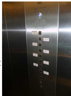
Aufzug Horst-Janssen-Museum / Stadtmuseum von Garderobe bis Ebene 8 mit Übergangsmöglichkeit ins Stadtmuseum