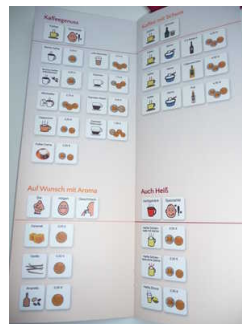
Speisekarte im Café Farbwechsel