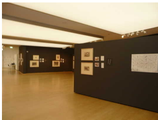
Ausstellungsraum 1.OG / 4. Ebene Horst-Janssen- Museum

Informationen zu den Exponaten werden schriftlich vermittelt. Es gibt akustische Informationen zu den Exponaten.