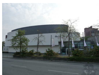
Horst-Janssen- Museum / Stadtmuseum