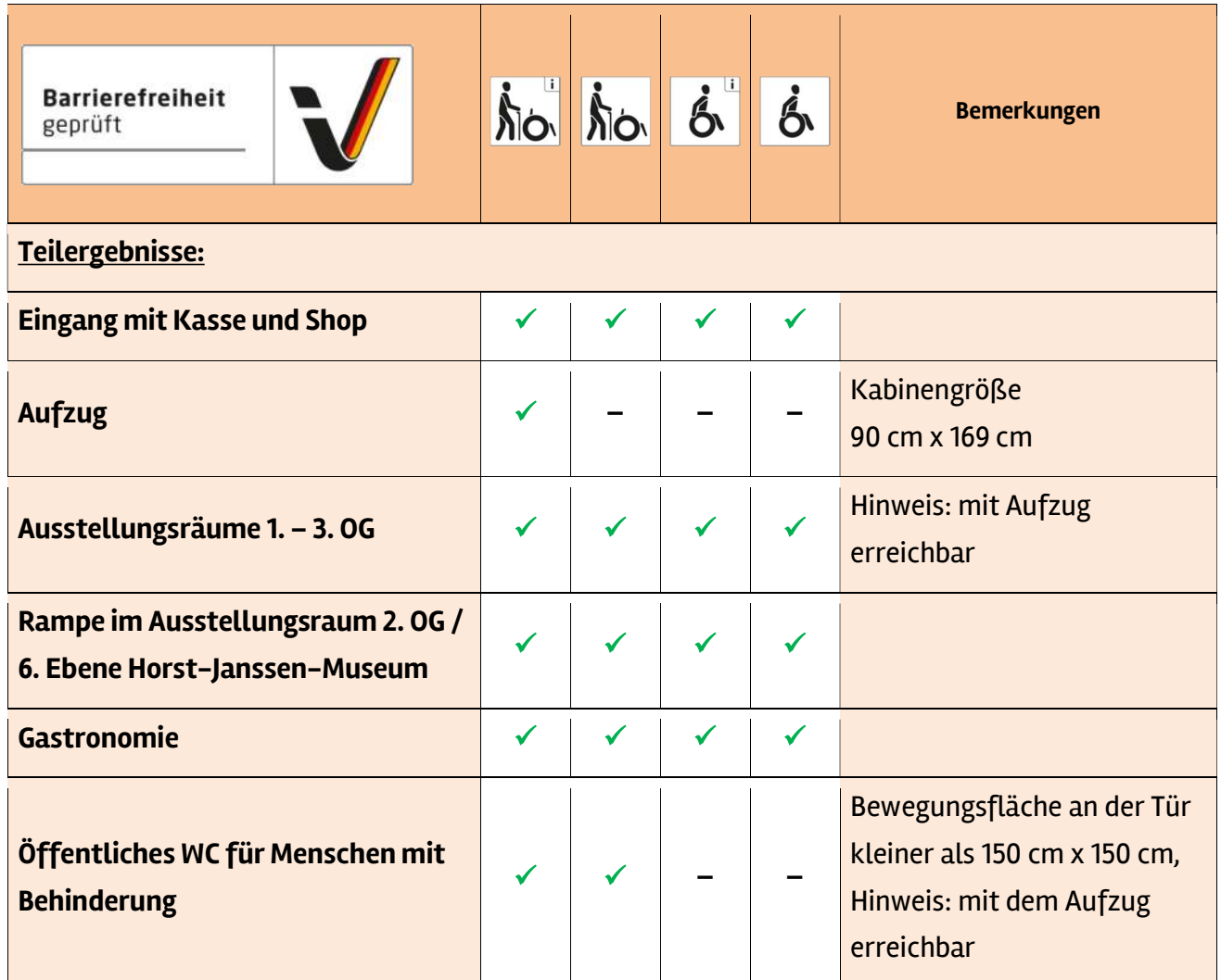
Tabelle 1: Überblick über das Prüfergebnis