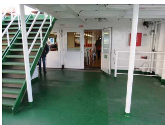
Weg von Rampe zum Fahrgastraum "Oberer Salon"