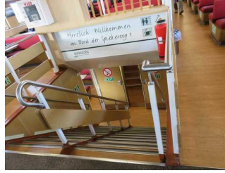
Wegeleitsystem auf der Fähre Spiekeroog II

Die Informationen sind in gut lesbarer Schrift vorhanden.