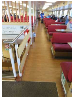
Fahrgastraum "Oberer Salon" Fähre Spiekeroog II