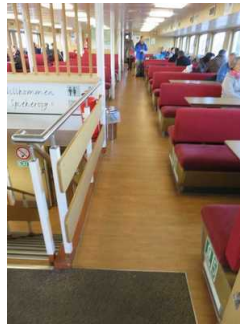
Fahrgastraum "Oberer Salon" Fähre Spiekeroog II