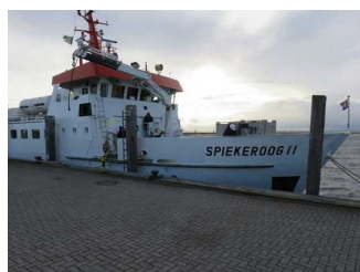
Fähre Spiekeroog II