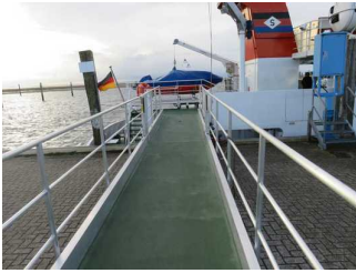
Zugang zur Fähre Spiekeroog II

Name und Logo des Betriebes/der Einrichtung sind von außen klar erkennbar.