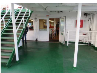
Weg von Rampe zum Fahrgastraum "Oberer Salon"