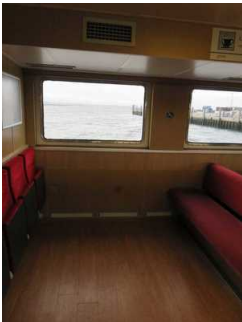
Vorgesehener Platz für Rollstuhlfahrer

Anmerkungen für den Gast: Vorgesehener Platz für Rollstuhlfahrer