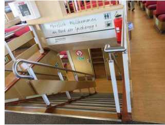
Wegeleitsystem auf der Fähre Spiekeroog II

Es sind Informationen vorhanden, die der Orientierung dienen und aus Wörtern bestehen.