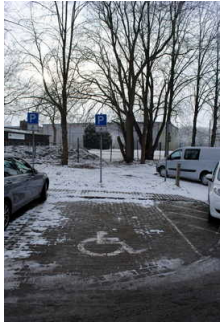
Küchenbereich in der Ferienwohnung