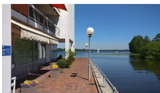
Appartement „Am Seeufer“