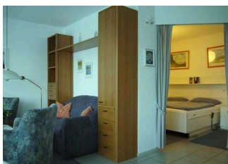
Blick in den Schlafräum