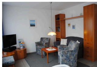
Appartement „Am Seeufer“