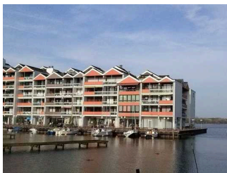
Außenansicht der Appartementanlage „Am Seeufer“