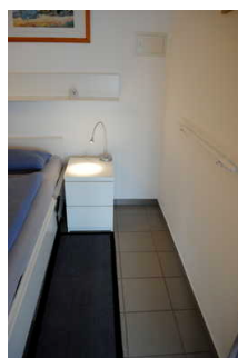
Schlafräum Gang rechts vom Bett