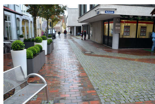
Blick von Fußgängerzone Marktstraße auf Fußweg/Straße