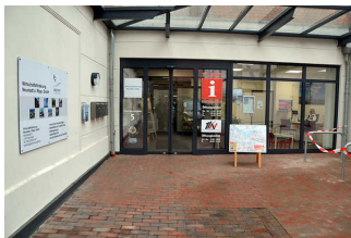
Touristinformation Neustadt am Rübenberge