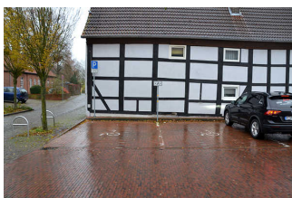
Öffentlicher Parkplatz "Entenfang" (hinter Sparkasse)