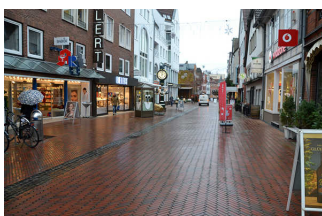
Fußgängerzone Marktstraße mit Blickrichtung Tourist-Info.