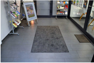
Flur zwischen Eingang TI und Tür TI