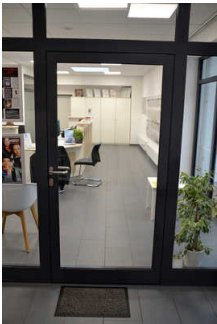
Weg zwischen Tür TI und Counter