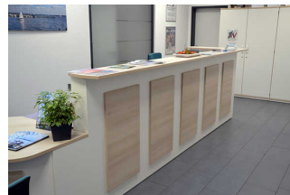
Counter der TI