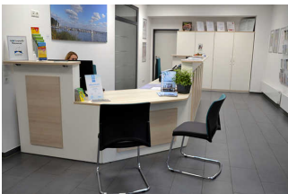
Counter der TI