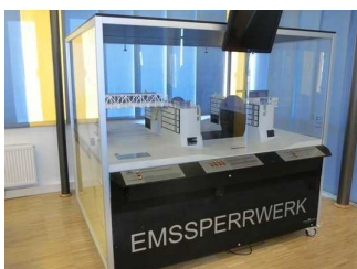
Modell des Emssperrwerks