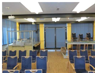
Sicht auf die Modelle