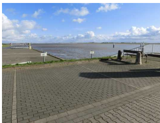
Parkplatz für Menschen mit Behinderung