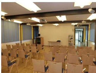
Vorführraum mit Leinwand