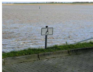
Beschilderung des Parkplatzes