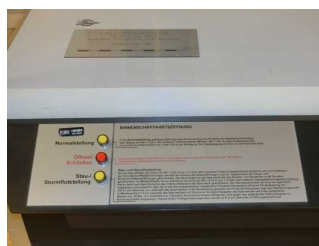
Bedienungselemente des Modells