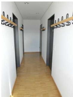
Weg vom Vorführraum zum WC für Menschen mit Behinderung im Gebäude

Ziel in Sichtweite oder unterbrechungsfreies Wegeleitsystem oder Wegezeichen in ständig sichtbarem Abstand: nein