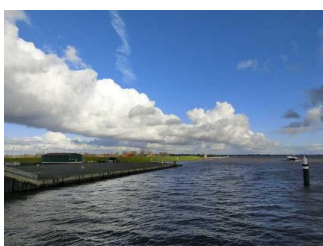
Besichtigungsweg im Außenbereich