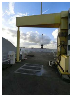
Besichtigungsweg im Außenbereich