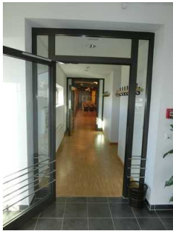
Weg vom Fahrstuhl zum Vorführraum