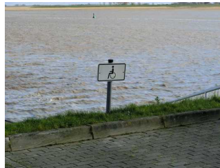
Beschilderung des Parkplatzes