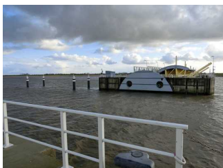
Besichtigungsweg im Außenbereich