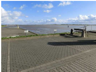
Parkplatz für Menschen mit Behinderung