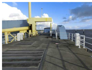
Besichtigungsweg im Außenbereich