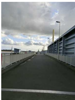
Besichtigungsweg im Außenbereich