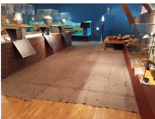
Ausstellungsraum 1. OG