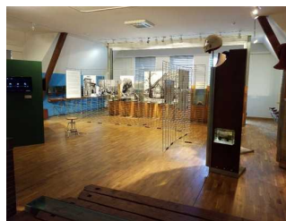
Ausstellungsraum 1. OG

Schmalste Durchgangsbreite des Raumes: 145 cm.