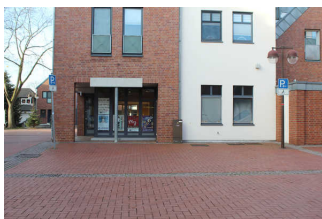
Parkplatz für Menschen mit Behinderung

Es ist ein allgemeiner Parkplatz vorhanden.