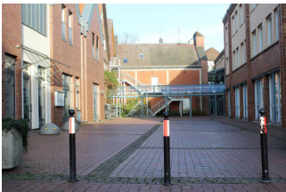
Weg vom Parkplatz zum Nebeneingang (Hinterhof)