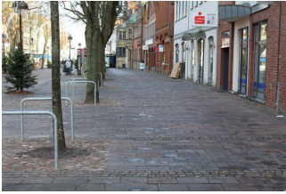
Weg vom Parkplatz zum Haupteingang (Lange Straße)