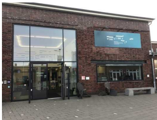
Windstärke 10 - Wrack- und Fischereimuseum Cuxhaven