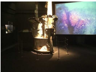
Unter Wasser -4