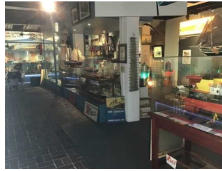
Sammlung Peter Weber