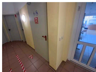
Bedienelemente / Leitsystem