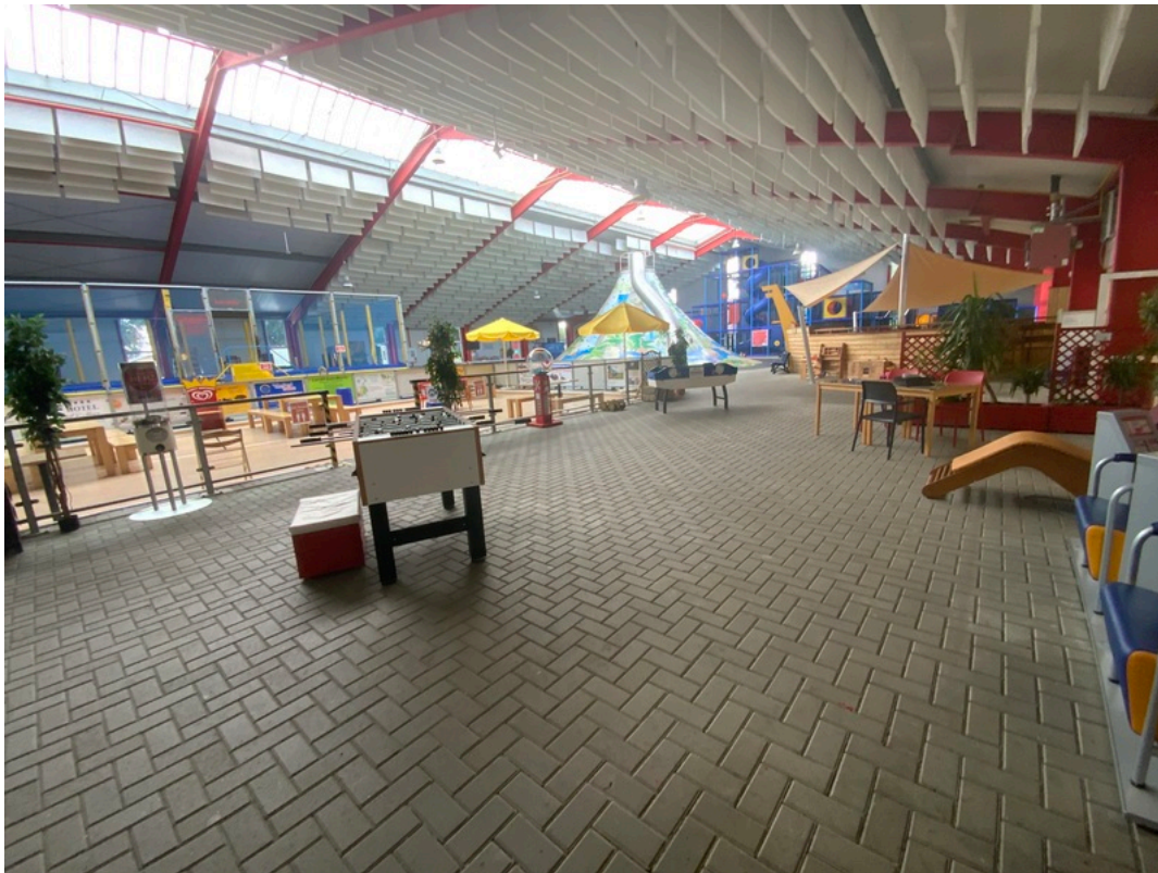
Spiel- & Spaß-Scheune Otterndorf