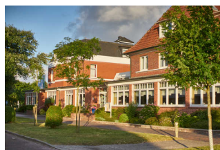
Außenansicht Haus Bethanien