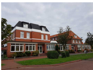
Außenansicht Haus Bethanien