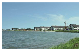
Ansicht des Dorfes vom Wasser aus