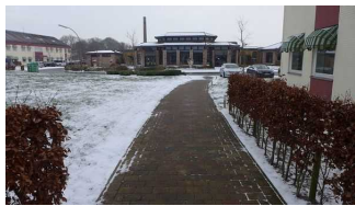
Außenanlage auf dem Hotelgelände