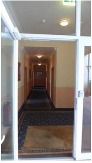
Flur vom Eingang zu den Zimmern