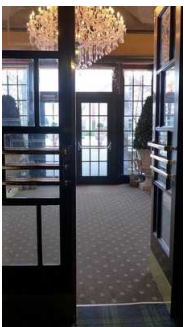
Gang vom Eingang bzw. WC zum Restaurant