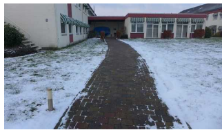
Außenanlage auf dem Hotelgelände