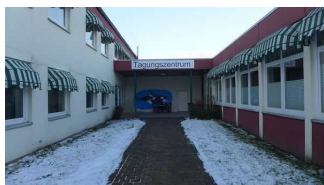
Außenanlage auf dem Hotelgelände