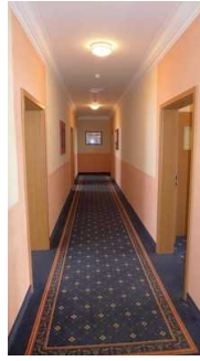
Flur vom Eingang zu den Zimmern