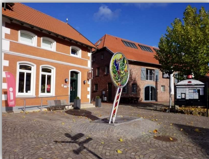
Tourist-Information Erholungsgebiet Dammer Berge e.V.