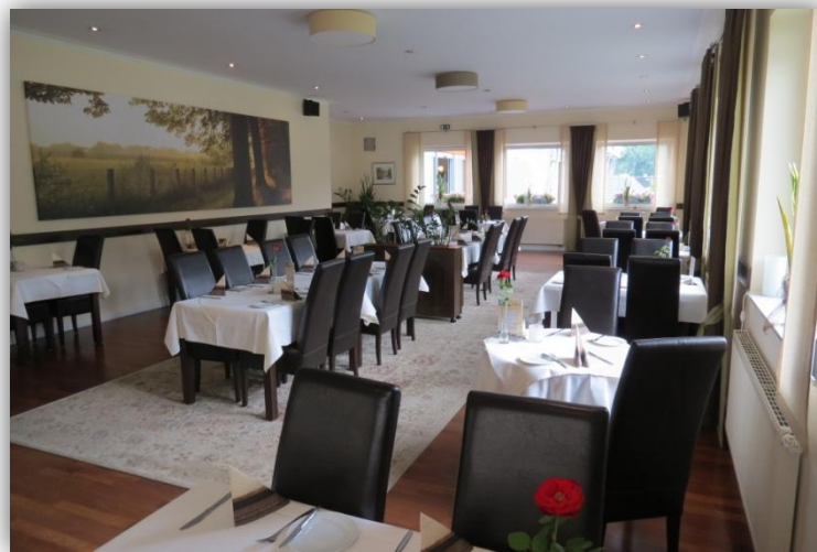
Innenansicht des Restaurants