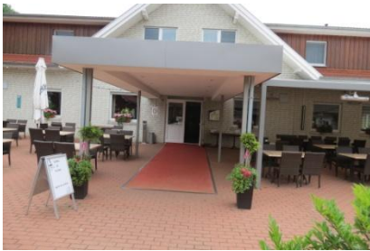
Eingangsbereich zu Hotel/Restaurant