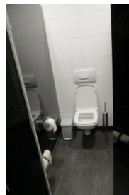
WC beim Restaurant