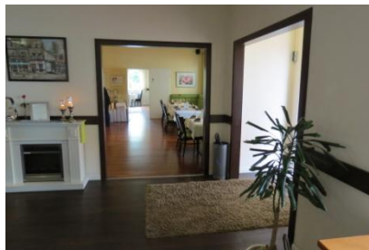
Eingangsbereich zu Hotel/Restaurant