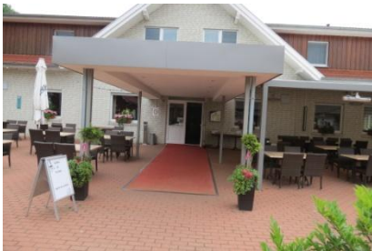
Eingangsbereich zu Hotel/Restaurant