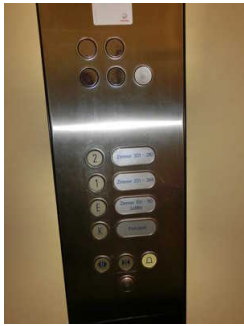
Bedientableau im Aufzug