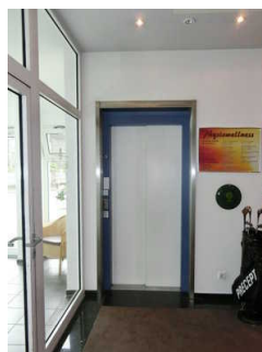
Einstieg - Aufzug zum öffentlichen WC für Menschen mit Behinderung