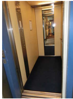
Aufzug zum öffentlichen WC für Menschen mit Behinderung

Ein abgehender Notruf im Aufzug wird akustisch bestätigt, z.B. durch eine Gegensprechanlage.