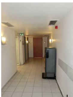
Flur vom Aufzug zum öffentlichen WC für Menschen mit Behinderung