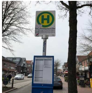
Bushaltestelle Bad Zwischenahn Auf dem Hohen Ufer