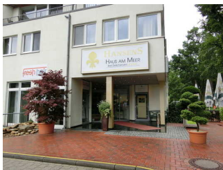
Hotel Haus am Meer