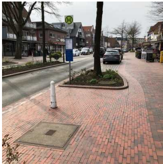
Bushaltestelle Bad Zwischenahn Auf dem Hohen Ufer