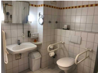
Hansens Haus am Meer