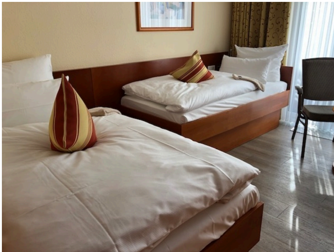
HansenS Haus am Meer