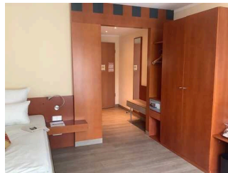
Zimmer 101 (EG)