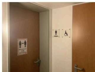
Bedienelemente / Gehbahn / Ausleuchtung / Beschilderung