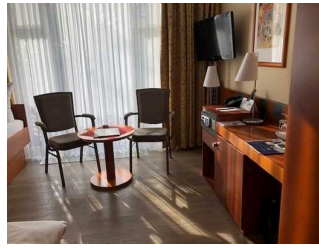
Hansens Haus am Meer