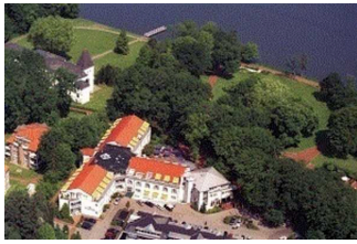
Hansens Haus am Meer