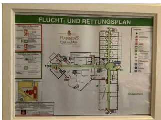
Hilfsmittel / Alarm / Allgemeines