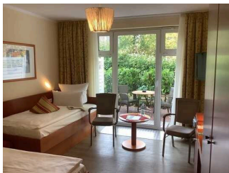
Zimmer 112 (EG)