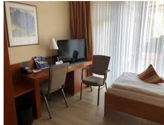
Hansens Haus am Meer