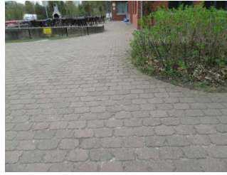
Außenweg vom P zum Eingang