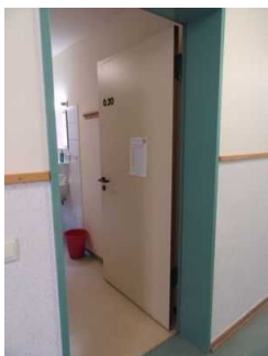
Tür zum Schlafräum JH Mardorf