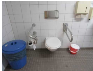
WC mit Haltegriffen