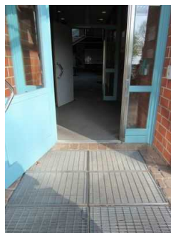
Eingangstür JH Mardorf

Die Tür ist keine Karussell- oder Rotationstür.