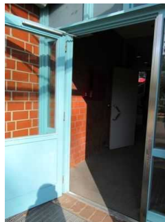
Eingang Jugendherberge Mardorf