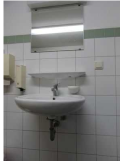
Waschbecken mit Spiegel