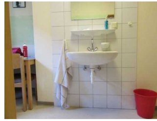
Waschbecken im Schlafraum