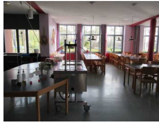
Speiseraum Jugendherberge Mardorf