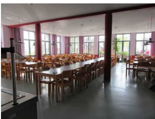
Speiseraum Jugendherberge Mardorf