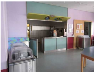
Speiseraum Jugendherberge Mardorf