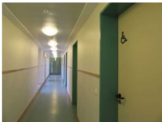
Flur zum Schlafraum