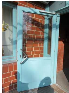
Eingangstür zur JH Mardorf