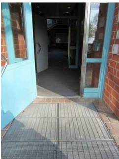
Eingangsbereich Jugendherberge Mardorf