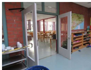
Eingang zum Speiseraum Jugendherberge Mardorf