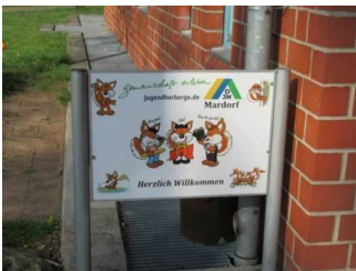
Beschilderung Jugendherberge Mardorf