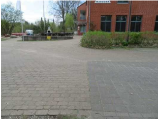
Weg zum Eingang