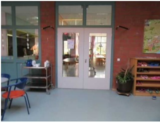
Speiseraum Jugendherberge Mardorf