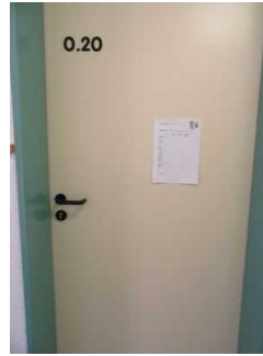
Tür zum Schlafraum