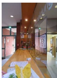
Eingangsbereich Jugendherberge Mardorf