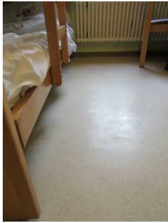
Bewegungsfläche im Zimmer