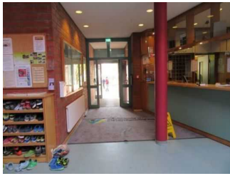
Eingangstür JH Mardorf