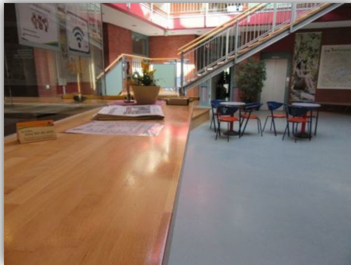
Rezeption in der Jugendherberge Mardorf