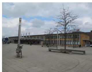
Sitzgelegenheiten auf dem Vorplatz Hauptbahnhof Wolfsburg