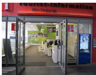
Eingangstür Tourist- Information