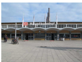
Eingangsbereich Hauptbahnhof Wolfsburg