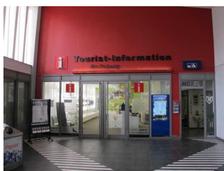
Eingang Tourist- Information