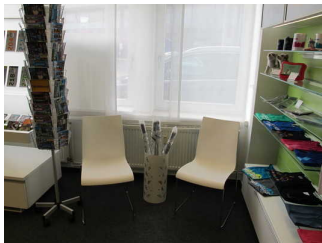
Sitzbereich 2 Tourist-Information