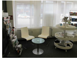
Sitzbereich 1 Tourist-Information