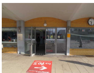
Eingangstür Hauptbahnhof Wolfsburg