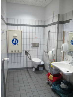
Öffentliches WC im Hauptbahnhof Wolfsburg