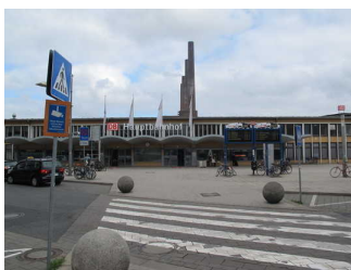
Vorplatz Hauptbahnhof Wolfsburg