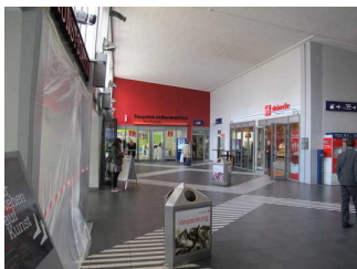
Weg durch die Vorhalle des Hauptbahnhofes zur Tourist-Information