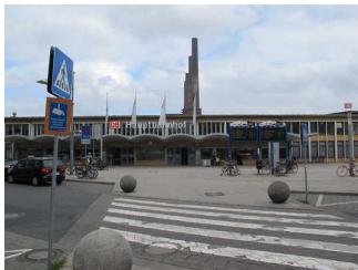
Vorplatz Hauptbahnhof Wolfsburg