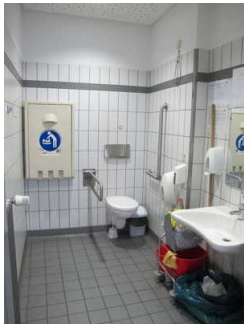
Öffentliches WC im Hauptbahnhof Wolfsburg

Anmerkungen für den Gast: Das WC befindet sich direkt neben den Räumlichkeiten der Tourist-Information.