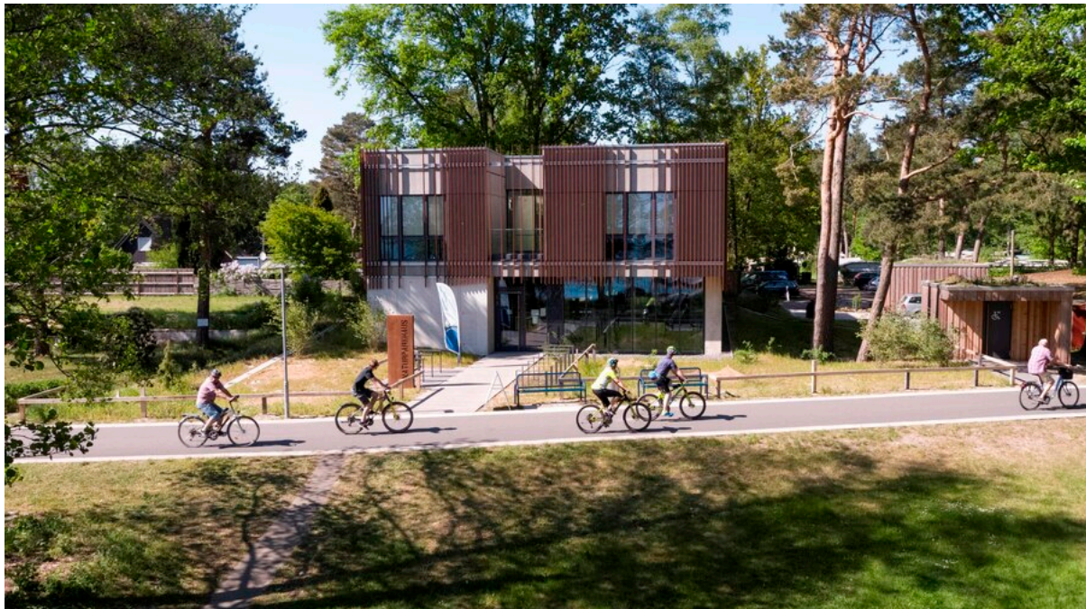
Naturparkhaus Mardorf