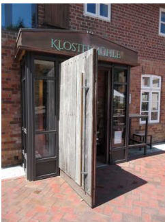
Haupteingangstür Restaurant, Rezeption und Tagungsraum