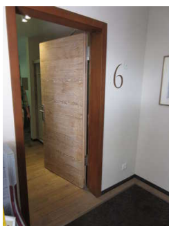
Zimmertür zu Zimmer Nr. 6