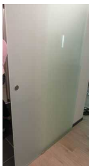
Schiebetür zum Bad