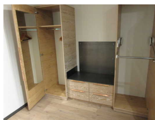
Schränke mit elektrischem Kleiderlift