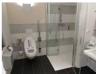
Bad mit Dusche / WC