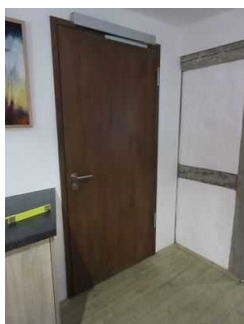
Tür zum Tagungsraum