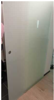
Schiebetür zum Bad