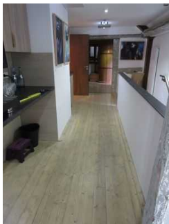
Weg vom Aufzug zum Tagungsraum im 1. OG