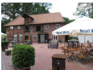
Weg außen vom Parkplatz zu beiden Gebäuden