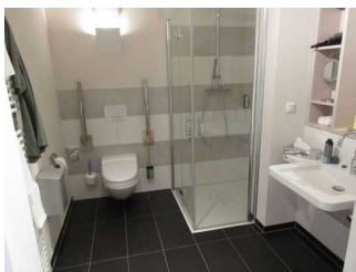
Bad mit Dusche / WC

Anmerkungen für den Gast: Bei dem WC handelt es sich um ein AquaClean (Dusch-WC) mit Fernbedienung.