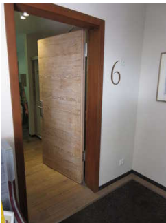
Zimmertür zu Zimmer Nr. 6