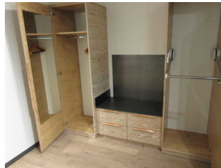
Schränke mit elektrischem Kleiderlift