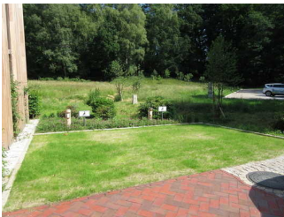
Parkplatz für Menschen mit Behinderung