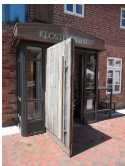
Haupteingangstür Restaurant, Rezeption und Tagungsraum