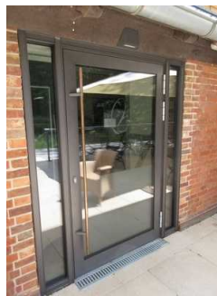
Zugang Terrasse über Gebäude