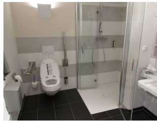
Bad mit Dusche / WC