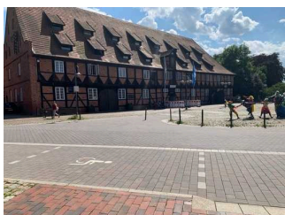
Behinderten – Pkw – Stellplatz