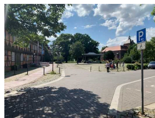
Behinderten – Pkw – Stellplatz