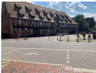
Museum im Marstall Winsen