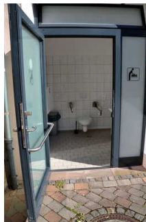
Öffentliches WC am Parkplatz