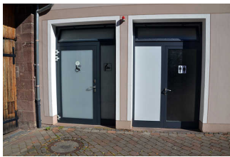
Öffentliches WC am Parkplatz