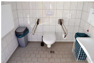
Öffentliches WC am Parkplatz