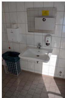
Öffentliches WC am Parkplatz