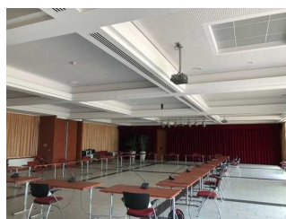
Saal und Tagungsraum "Wandelhalle"