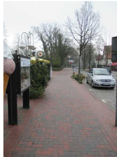
Weg zur Wandelhalle

Es sind Wegezeichen in sichtbarem Abstand vorhanden.