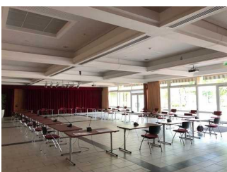
Der Saal ist individuell bestuhlbar.