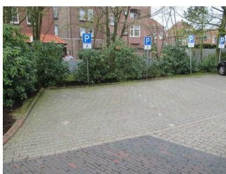
Stellplätze für Menschen mit Behinderung