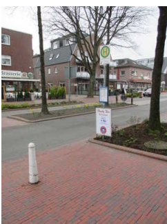
Bushaltestelle "Auf dem Hohen Ufer"