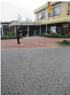
Weg Parkplatz bis Eingang Wandelhalle