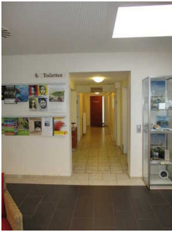
Flur/Gang zum WC