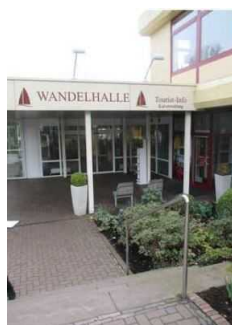
Bild von Eingangsbereich

Name bzw. Logo des Betriebes/der Einrichtung sind von außen klar erkennbar.