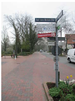
Wegweiser zu Tourist-Info und Wandelhalle

Es sind Informationen vorhanden, die der Orientierung dienen und aus Wörtern bestehen.