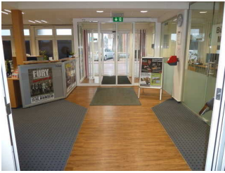
Tresen im Schalterraum