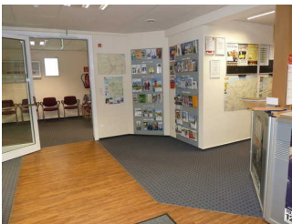
Schalterraum - Informationsecke