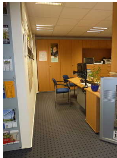
Beratungsecke und abgesenkter Tresen