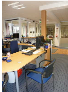
abgesenkter Tresen und Beratungsbereich im Schalterraum

Der Schalter/Tresen/die Kasse ist hell ausgeleuchtet.