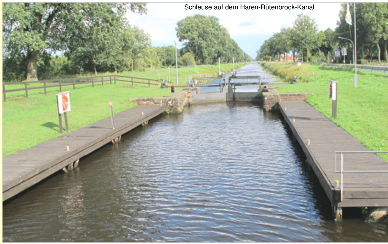
Schleuse auf dem Haren-Rütenbrock-Kanal